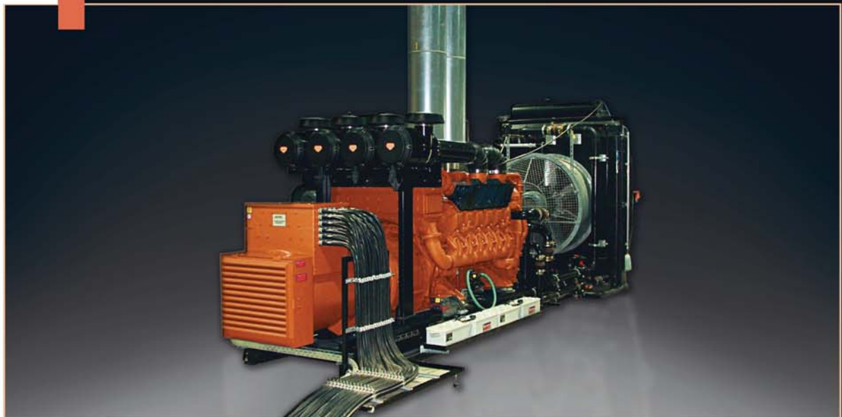
Netzersatzanlage D 1400-4 MWE, Leistung 1400 kVA, zur Notstromversorgung eines Klinikums.